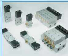
Kompakt-Serie MD 16