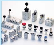
Manuell- und mechanisch betätigte Ventile