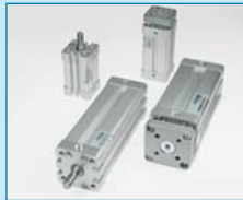
Kompaktzylinder ISO 21287