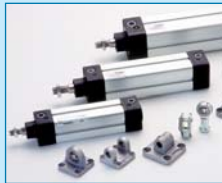
Zylinder ISO 15552