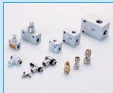
Sperr- und Stromventile