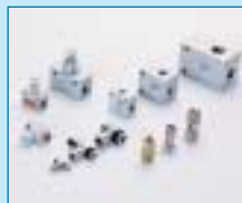
Sperr- und Stromventile