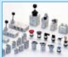
Manuell- und mechanisch betätigte Ventile