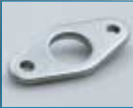
Boden- oder Kopfflansch