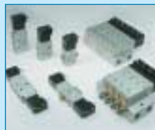
Kompakt-Serie MD 16