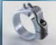
Befestigung für Näherungsschalter