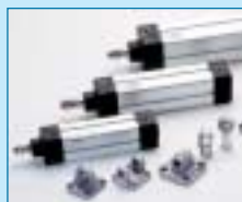
ISO 6431 Zylinder